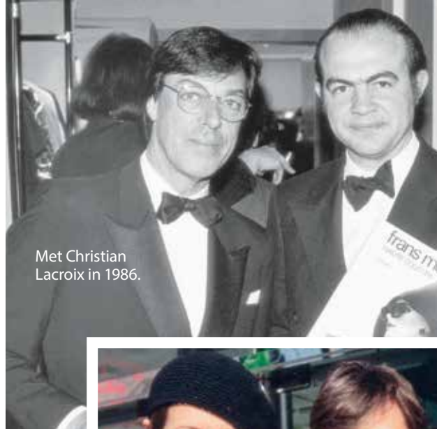
Met Christian Lacroix in 1986.