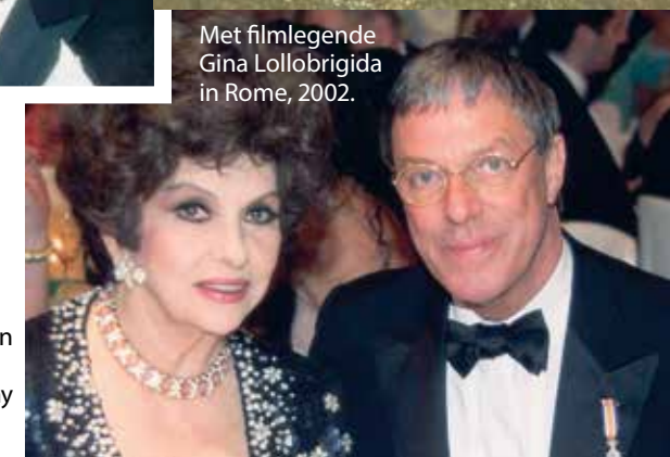
Met filmlegende Gina Lollobrigida in Rome, 2002.