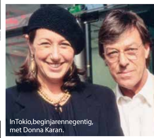
In Tokio, begin jaren negentig, met Donna Karan.