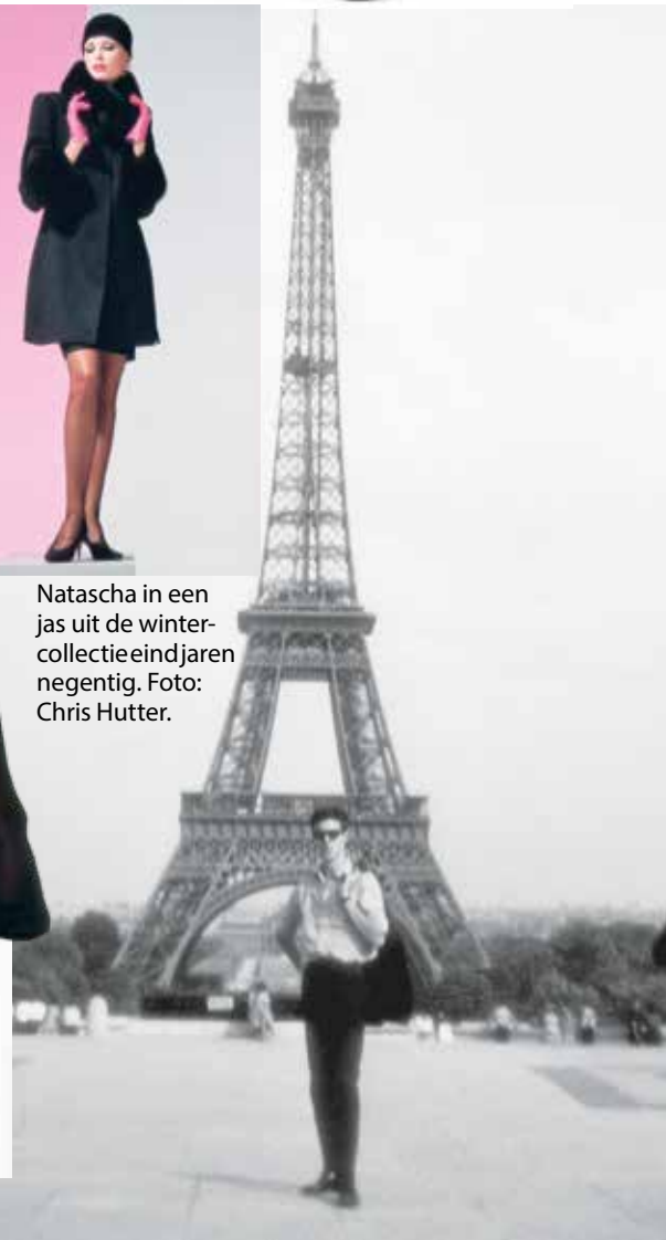
Een jonge couturier in Parijs, 1958.