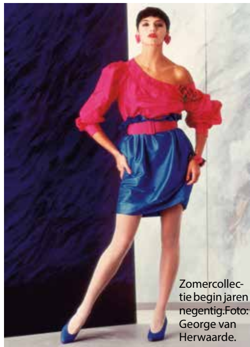
Zomercollectie begin jaren negentig.