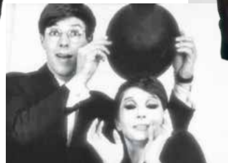
Met Zizi Jeanmaire in 1963.