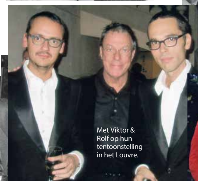
Met Viktor & Rolf op hun tentoonstelling in het Louvre.