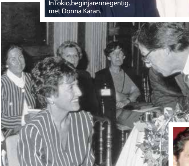
Tijdens een modeshow op Paleis Het Loo met prinses Margriet.