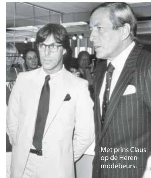
Met prins Claus op de Herenmodebeurs.