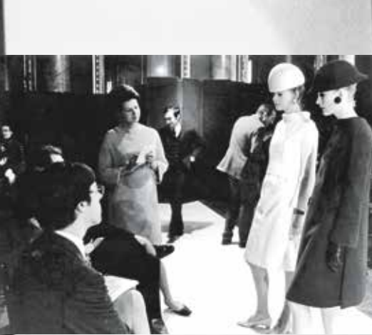
Zijn eerste show in Parijs in 1967 in het Intercontinental Hotel. 'Ik was met een Volkswagenbusje met 35 creaties en vier modellen zelfnaarde show gereden. Ik kreeg laaiende kritieken in Le Figaro en de New York Times.'