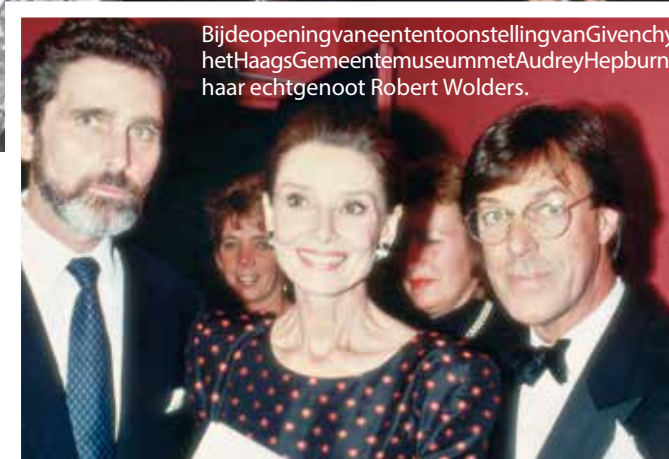
Bij de opening van een tentoonstelling van Givenchy in het Haags Gemeentemuseum met Audrey Hepburn en haar echtgenoot Robert Wolders.