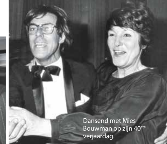
Dansend met Mies Bouwman op zijn 40 ste verjaardag.